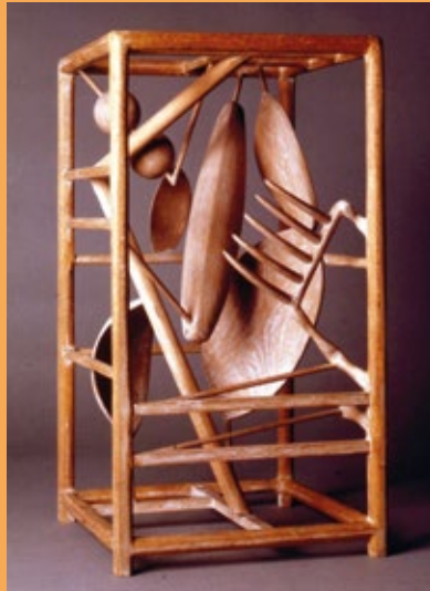
Cage, A. Giacometti, 1931

À quoi sert l'angoisse ? Son usage dans l'expérience analytique