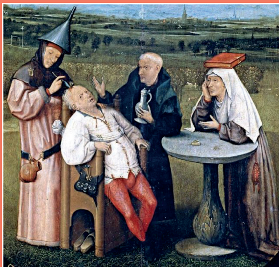
« L'Extraction de la pierre de folie », Jérôme Bosch.

De la psychose extraordinaire à la psychose ordinaire